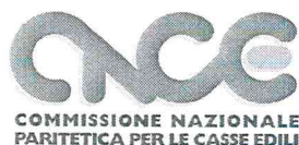
TABELLA CODIFICHE APPRENDISTATO V3 (22/05/2019) CCNL INDUSTRIA E COOPERAZIONE (accordo 4 aprile 2019)

Con la presente tabella sono fornite le nuove codifiche applicabili ai profili introdotti dall'accordo industria e cooperazione del 4 aprile 2019. A tale accordo deve essere fatto riferimento per quanto non indicato dalla presente tabella. Le vecchie codifiche saranno applicate fino al termine di ultimazione dei rapporti di lavoro precedentemente sottoscritti.